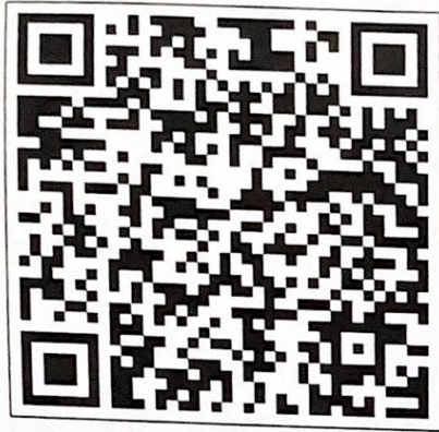
๑.พ.ร.บ.การไกล่เกลี่ยฯ