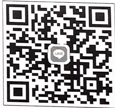
๔.LINE : สยจ.นฐ.